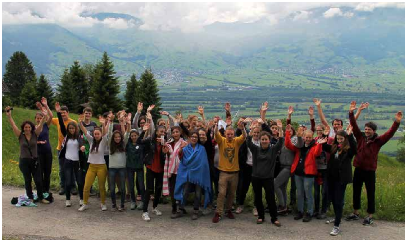
L'association « Ville des Alpes de l'Année » et ses membres participent à plusieurs projets destinés à encourager une vraie participation des jeunes dans les Alpes. La liste déjà longue des exemples de pratiques réussies montre que cet engagement porte ses fruits.