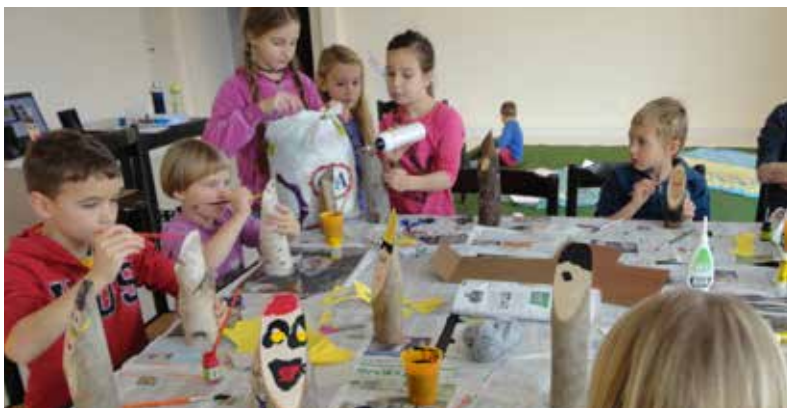
Dans presque toutes les Villes des Alpes, des conférences, des lectures publiques ou des ateliers de travaux manuels ont été organisés à l'occasion de la campagne « Lire les montagnes » de la Convention alpine, comme ici à Tolmin.